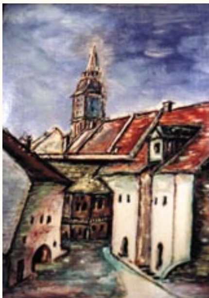
Középkori utcarészlet, olaj

Cím: 1112 Budapest Vófély u. 1. l/8 Foglalkozás: műv. központ igazgató