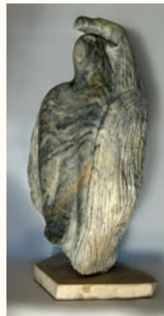
Különös pár, rakocai márvány, 45 cm a 2003. évi kiállítás zsűrizett alkotása