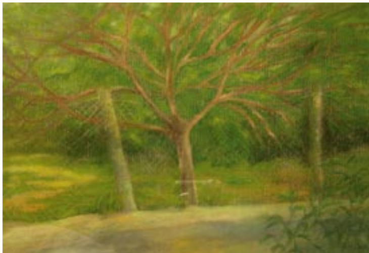
Kerítés, 30 x 40 cm a 2003. évi kiállítás zsűrizett alkotása