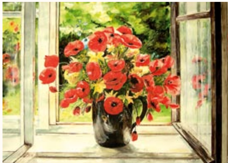
Pipacs triptichon, tempera, 46 x 66 cm a 2003. évi kiállítás zsűrizett alkotása

Díjaim: Veszprém - Pedagógus tárlat 2002, nívódíj Debrecen - SZKIOSZ kiállítás 2002, festészeti díj