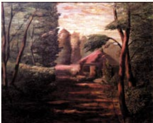
Borsodi táj, olaj

Képeim a világ minden táján megtalálhatóak