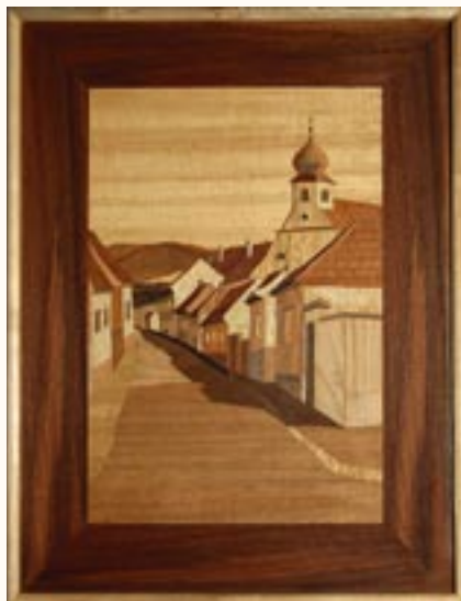
Tettye utca, intarzia, forgács lemez 48 x 36 cm a 2003. évi kiállítás zsűrizett alkotása

1963-tól foglalkozom grafikával, festéssel. Intarziákat is készítek 20 egyéni és 22 közös kiállításon vettem részt. Eddigi munkásságom során 3 díjban részesültem.