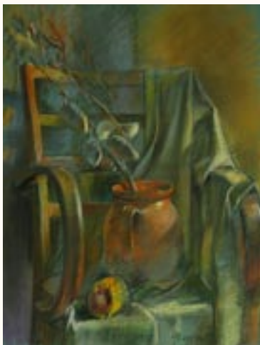
Csendélet, pasztell, 63 x 48 cm a 2003. évi kiállítás zsűrizett alkotása