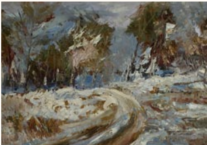
Erdőszelvény II., olaj, farost, 20 x 29 cm a 2003. évi kiállítás zsűrizett alkotása

Művészetemről többek között Zatkalik András (Ki amatőr, ki profi) és Kellei György (Akinek dilije a napraforgó) írásai jelentek meg a Veszprém Megyei Naplóban.