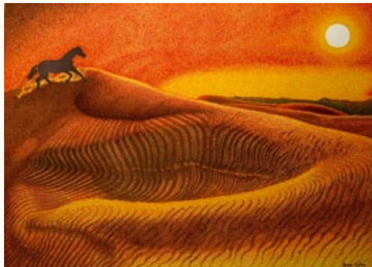
Sivatag, filctoll, papír, 50 x 70 cm a 2003. évi kiállítás zsűrizett alkotása

1999.-ben a Gizella napok I. díját kaptam (pontozásos grafika)