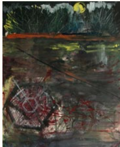
A tükör, tempera, 50 x 42 cm a 2003. évi kiállítás zsűrizett alkotása

1 egyéni és 21 közös kiállításon vettem részt.