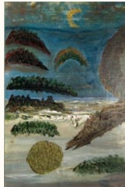
Képfantázia, olaj, farost, 47 x 30 cm a 2003. évi kiállítás zsűrizett alkotása