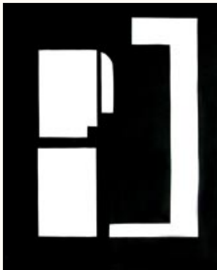
Árnyak II., kollázs, 40 x 50 cm a 2003. évi kiállítás zsűrizett alkotása