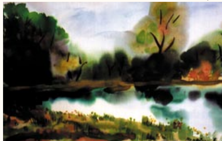
Hernád holtág, akvarell

1998 óta foglalkozom festéssel. 14 egyéni és 3 közös kiállításon vettem részt. Legfontosabb kiállításaim: 2002 Románia/Erdély, Kolozsvár közös kiállítás Zsobok – Kalotaszeg alkotótábor