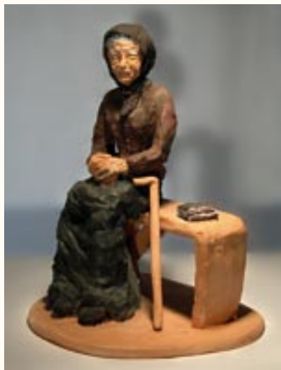
Magány, kerámia, 21 cm a 2003. évi kiállítás zsűrizett alkotása

Cseppkőszobraimmal Franciaországban a Cannes-i Fesztiválpalotában a hazánkat képviselő csoport tagja voltam.