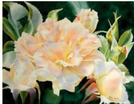
Szt. Erzsébet rózsái, akvarell, 50 x 70 cm a 2003. évi kiállítás zsűrizett alkotása

„Írisz-tánc” című képem I. díjat nyert a Mother Lode művészeti kiállításon (Placerville, California, USA) és részt vett az Iowai Akvarellfestő Szövetség vándorkiállításán (USA).