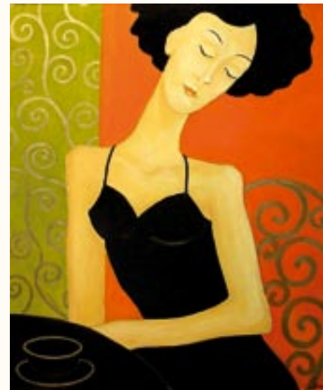
„Forró fekete”, olaj, farost, 70 x 50 cm a 2003. évi kiállítás zsűrizett alkotása

22 egyéni és számos közös kiállításon vettem részt.