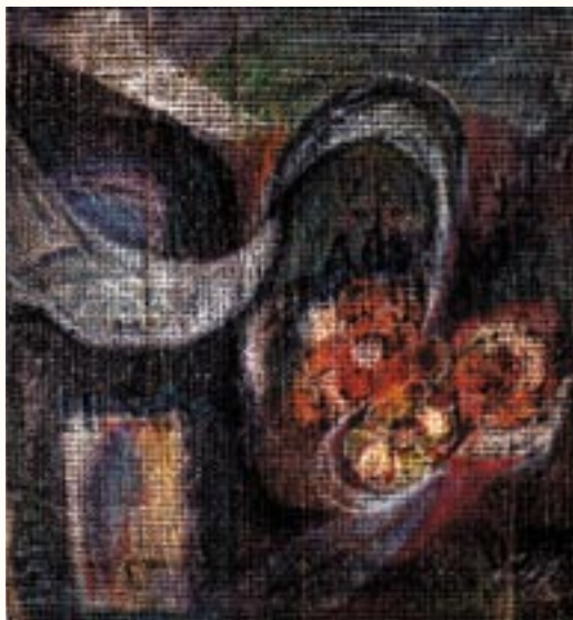
Anyám emlékére, zsírpasztell

1992-től foglalkozom festéssel (akvarell, pasztell). 4 egyéni és 40 közös kiállításon vettem részt.