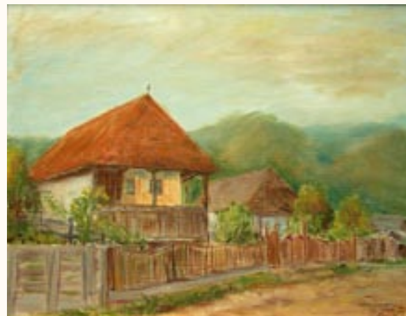
Székelyföldi emlék, olaj, vászon, 38 x 50 cm a 2003. évi kiállítás zsűrizett alkotása

Alkotásommal elnyertem a Hajdú-Bihar megyei Közművelődési Intézet különdíját.