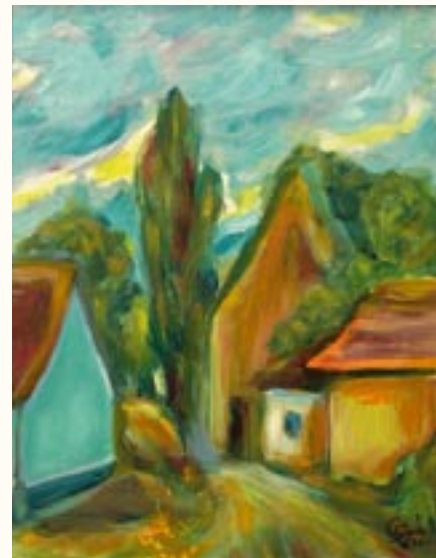
Móri utca, olaj, farost, 40 x 50 a 2003. évi kiállítás zsűrizett alkotása

Gyermekkorom óta rajzolk és festek, 1996-tól olajfestményeket is készítek. 2 egyéni és 8 közös kiállításon vettem részt. Közgyűjteményekben 1 alkotásom látható. Díjaim: Oklevél, kis plakett, dicséret. Közös Vasas – Szakköri kiállítás, és a Jászapáti Múzeumban egyéni kiállítás.