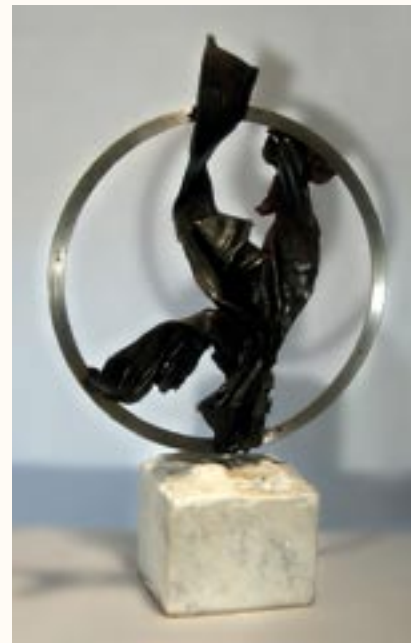
Körbe zárva, fém, 38 cm a 2003. évi kiállítás zsűrizett alkotása

Moszkvai kiállításon egyedül képviseltem Magyarországot szobrászatban.