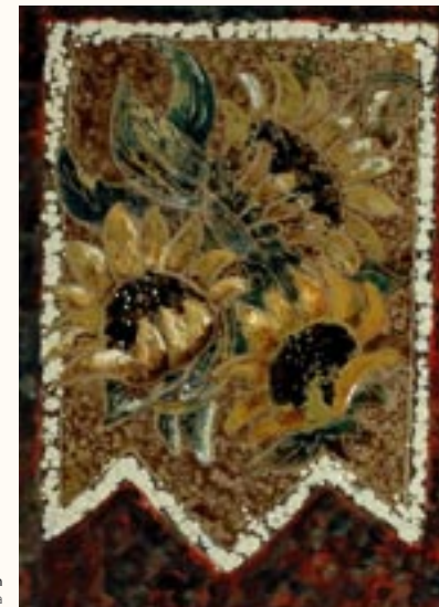
Napraforgók, tűz- és ékszerzománc, 32 x 21 cm a 2003. évi kiállítás zsűrizett alkotása