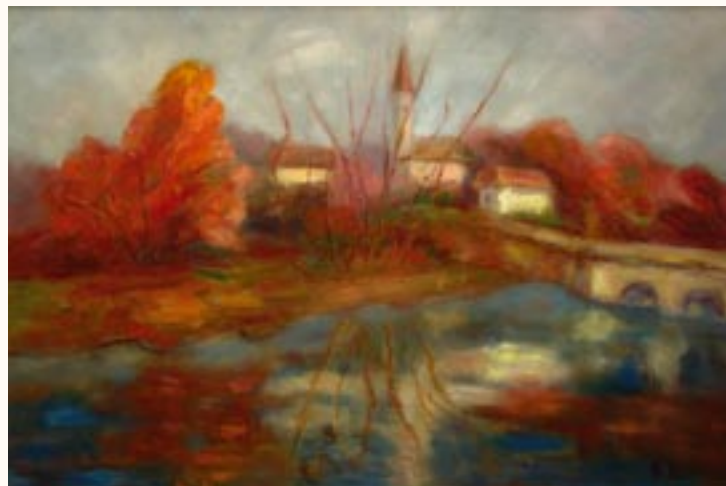
Táj, olaj, farost, 40 x 60 cm a 2003. évi kiállítás zsűrizett alkotása

Alkotásom csoportos kiállításon szerepelt Bécsben a Collegium Hungaricumban.