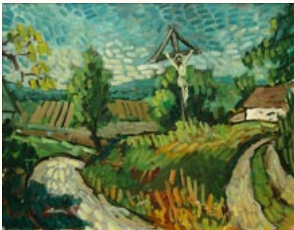
Sójtóri pléh Krisztus, olaj, vászon, 40 x 50 cm a 2003. évi kiállítás zsűrizett alkotása

1990 Ausztria Nemzetközi Képzőművészeti Kiállítás