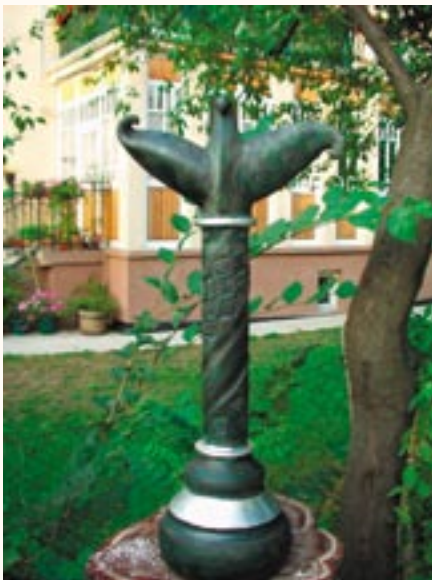
Turul allegória, kerámia, 57 cm a 2003. évi kiállítás zsűrizett alkotása

Tagja vagyok a Parázs művészeti csoportnak akkivel számos hazai és külföldi kiállításon vettem részt.