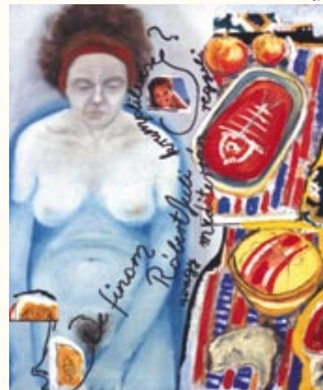
De finom..., vegyes

Több egyéni és közös kiállításon szerepeltem.