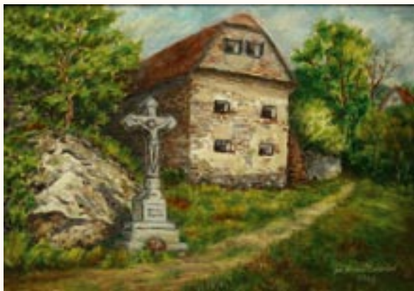
Templomhoz vezető út, olaj, farost, 35 x 50 cm a 2003. évi kiállítás zsűrizett alkotása

Nyolc alkalommal szerepeltem országos kiállításon munkáimmal, melyek több kiadványban láthatóak. Két rézkarcom van a Herman Múzeumban.