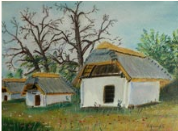
Cáki pincesor, pasztell, 24 x 33 cm a 2003. évi kiállítás zsűrizett alkotása

Megkaptam a Fejér Megyei Kor-Társ Ki-Mit-Tud kategória díját (akvarell)