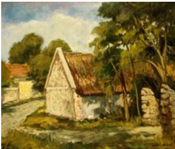
Öreg ház, olaj, farost, 50 x 60 cm a 2003. évi kiállítás zsűrizett alkotása

Számomra kiemelkedő jelentőségű a művésztelepeken megszerzett tudás alkalmazása, kipróbálása, új barátok megismerése.