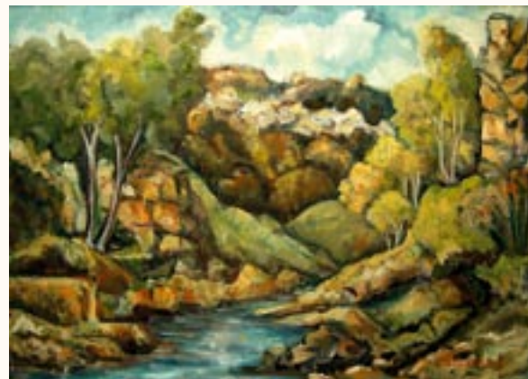
Ősz a patak mentén, olaj, farost, 50 x 70 cm a 2003. évi kiállítás zsűrizett alkotása

Magyar Nemzeti Bizottságának Díja kiváló munkáért.