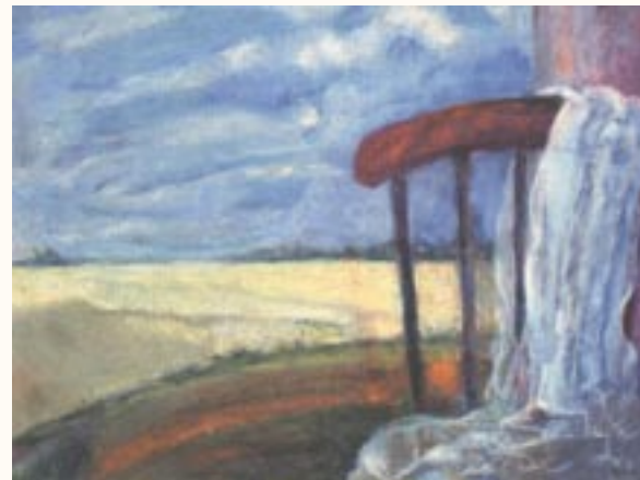
Kilátás a teraszról, pasztell

Eddigi munkásságom során 5 díjban részesültem. Számomra kiemelkedő jelentőségűek az Országos Vasas Amatőr Képző- és Iparművészeti Kiállításokon való szerepléseim. (1985, 1991)