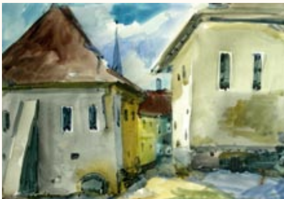
Sikátor, akvarell, 35 x 50 cm a 2003. évi kiállítás zsűrizett alkotása

10 egyéni és 200 közös kiállításon vettem részt.