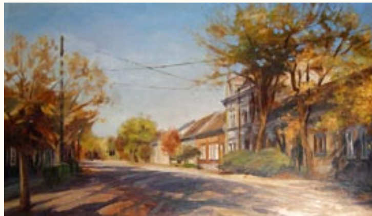
Kisvárosi utca, olaj, farost, 40 x 70 cm a 2003. évi kiállítás zsűrizett alkotása

Festéssel foglalkozom. 3 egyéni és 6 közös kiállításon vettem részt.