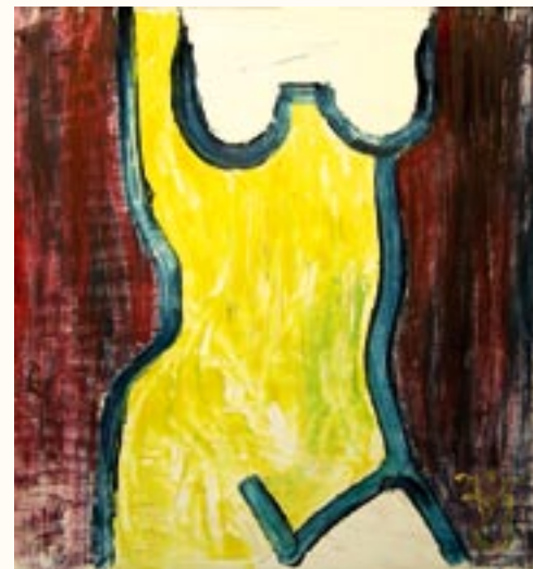
Nő az ablakban, olaj, rétegelt lemez, 52 x 47 cm a 2003. évi kiállítás zsűrizett alkotása